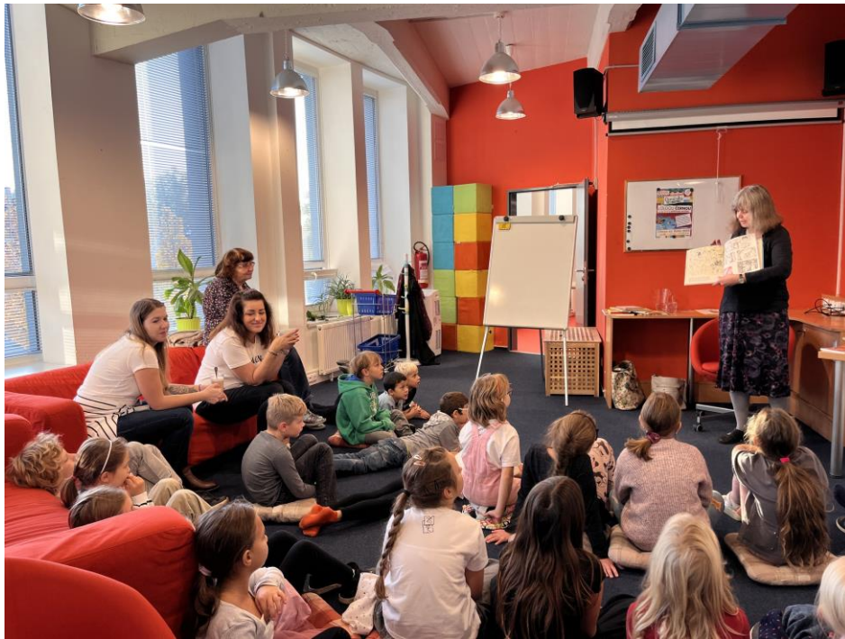
Beseda se spisovatelkou Olgou Černou