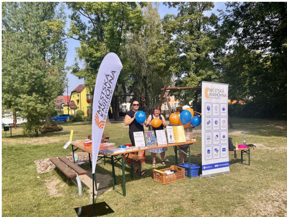
Festival volnočasových aktivit