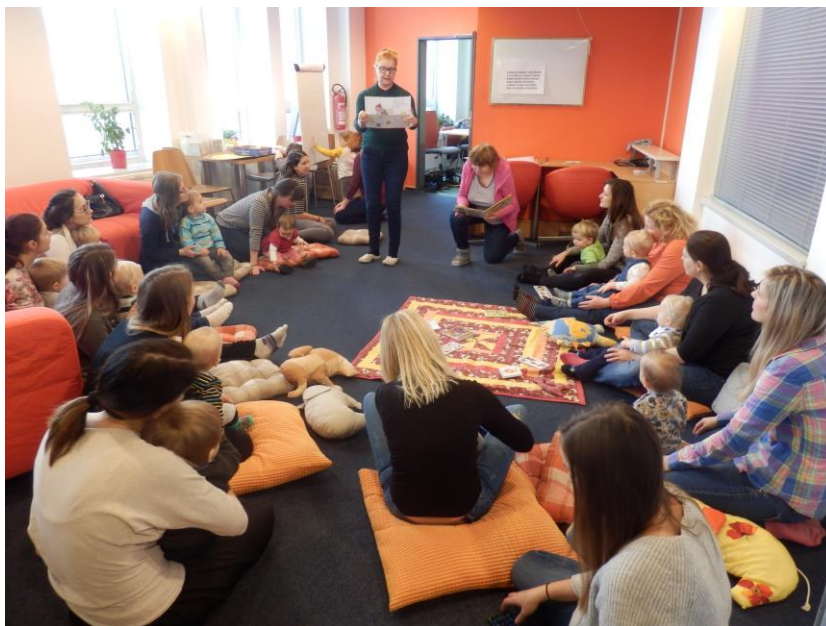
Klubík pro děti do 3 let

Knížka pro prvňáčka – kniha z projektu je předána prvňáčkům na slavnosti „Pasování na čtenáře knihovny“, které tento rok proběhlo až v září.