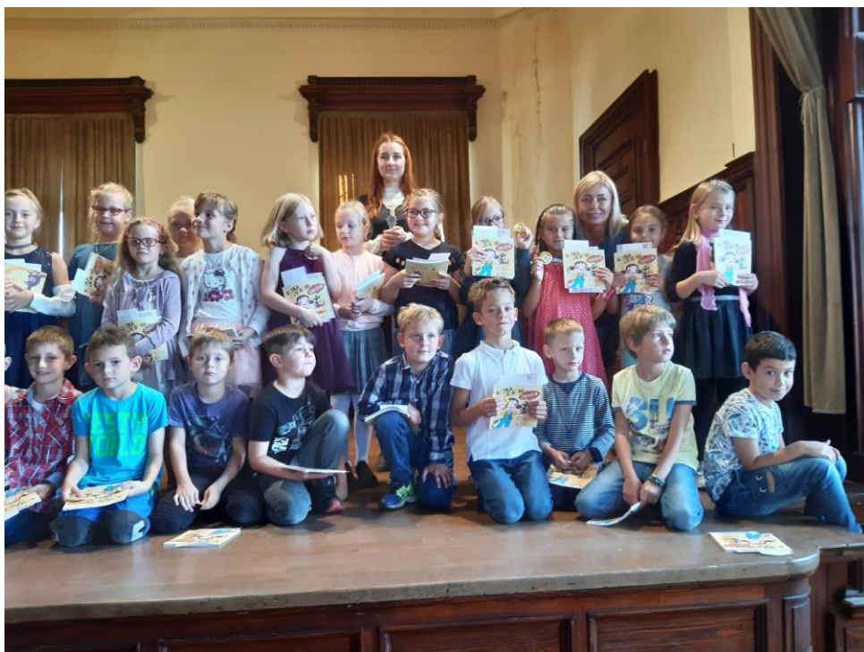
Pasování na čtenáře knihovny